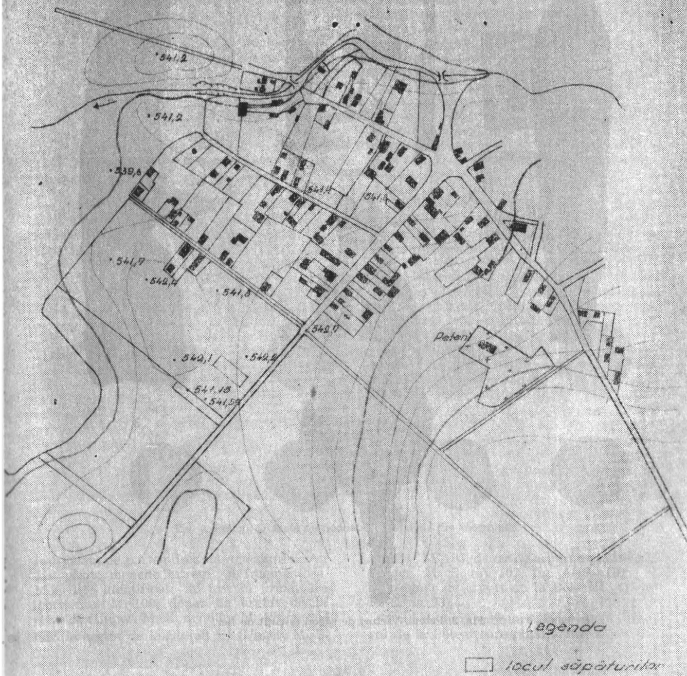
Fig. 1. Peteni. Locul săpăturii.